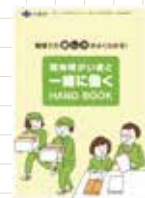
精神障がい者と一緒に働く HANDBOOK