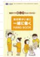
知的障がい者と一緒に働く HANDBOOK