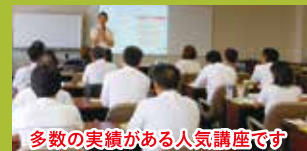
多数の実績がある人気講座です